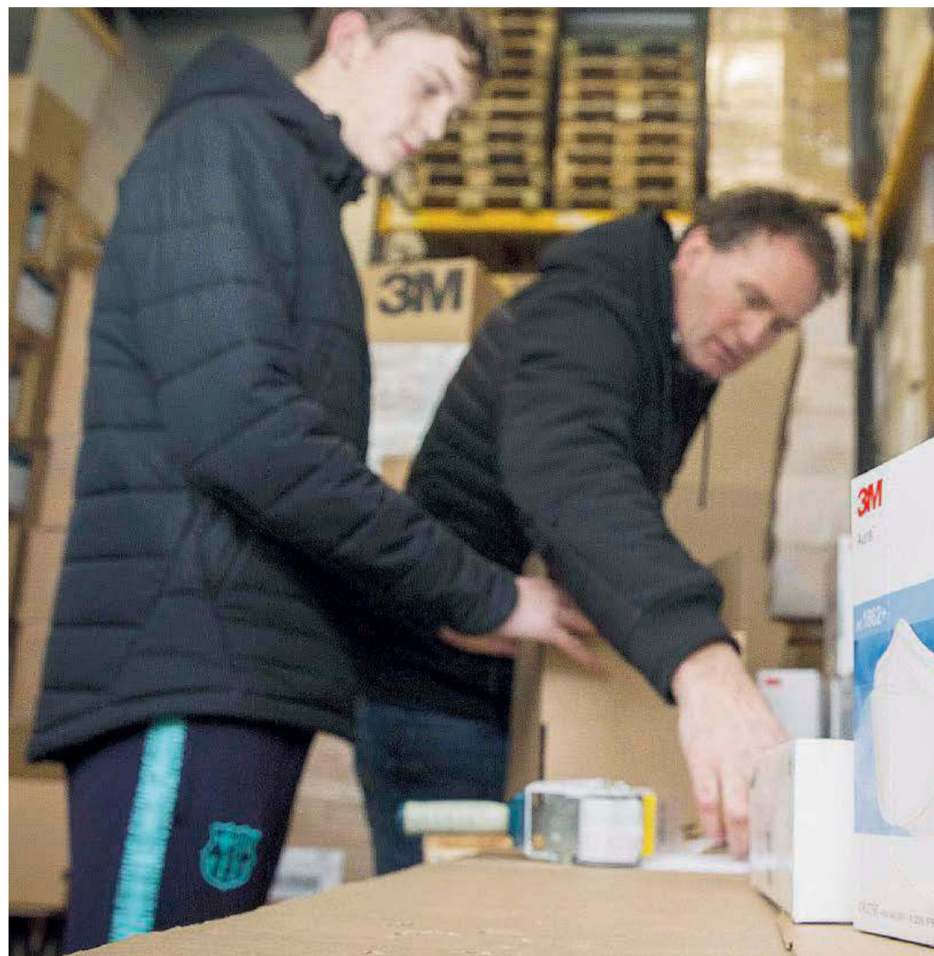
Mascherine esaurite I cosentini non hanno badato a spese per rifornirsi dei presidi essenziali di protezione